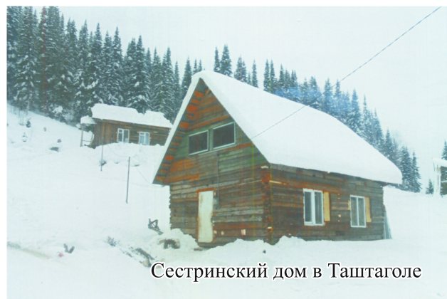
Сестринский дом в Таштаголе

По прибытии в Братский дом вновь прибывшему, предоставляется спальное место, постельное белье и все необходимое для жизни без излишеств. Ежедневно в Братском доме проходят христианские беседы, чте-