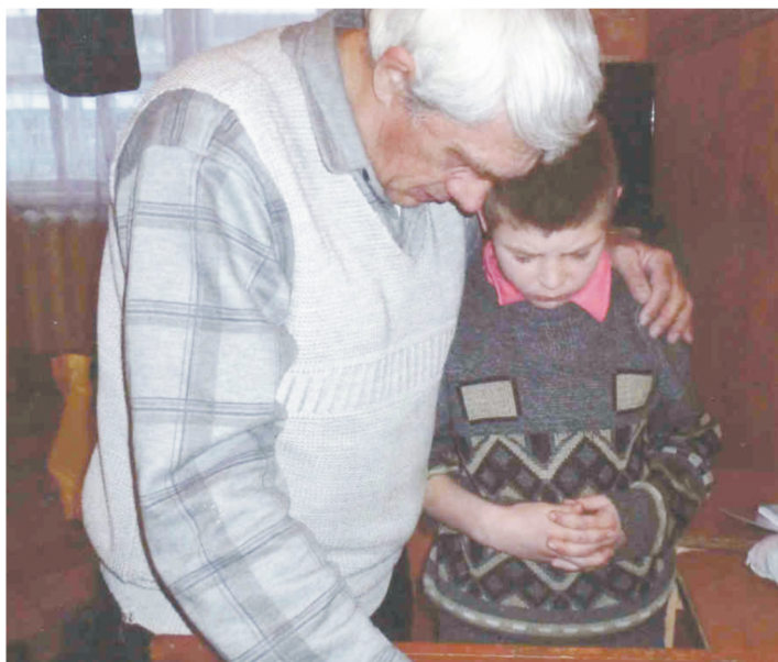
Молитва маленького христианина: «Иисус Христос, благослови человека, который убил мою маму восьмого марта. Сделай так, чтоб ему было хорошо».