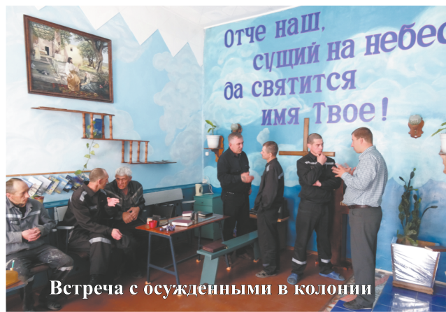
Встреча с осужденными в колонии

Любое дело, если хотим, чтобы оно было благоугодно Богу, начинается с поста и молитвы. Господь побуждает братьев и сестер на этот духовный труд.